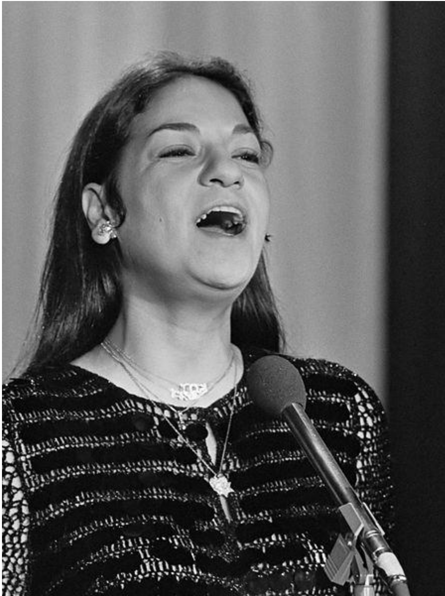
Frida Boccara en 1975

Primée dans de nombreux festivals internationaux, de Tokyo à Mexico ou de Rio de Janeiro à Sofia... Frida Boccara poursuit une carrière internationale.