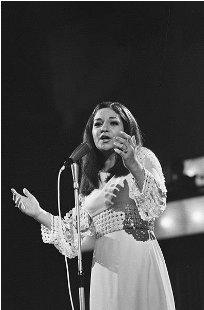
Frida Boccara en 1970