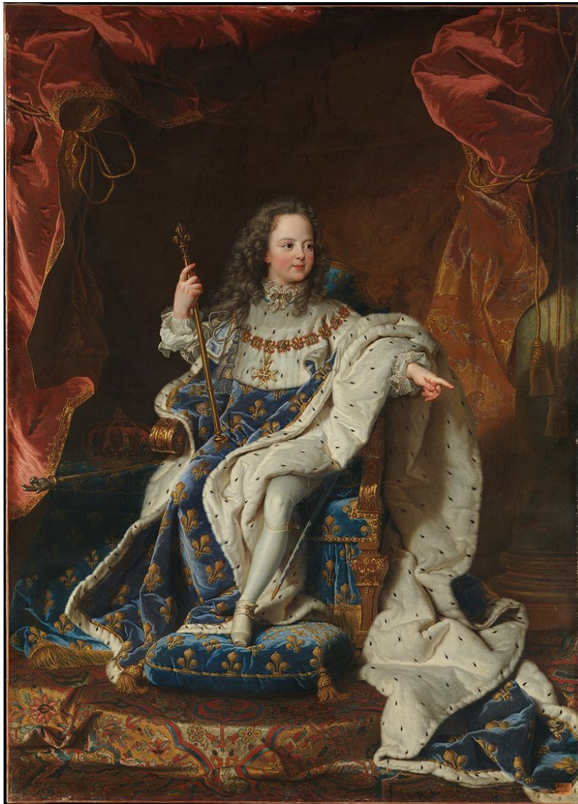
Le roi Louis XV, enfant

Qui choisir entre les pas assez riches, pas assez âgées, trop âgées, calvinistes... ?