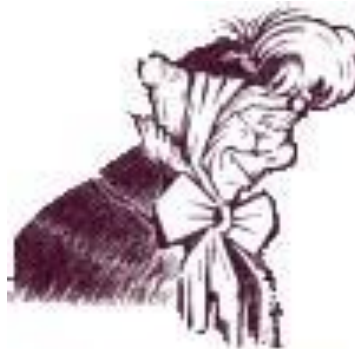
la mère Cottivet

La Mère Cottivet a aussi été interprétée par l'acteur et directeur d'une compagnie théâtrale Benoist-Mary. Ce Lyonnais pure souche s'est fait aussi chansonnier et auteur de saynètes en vieux dialecte lyonnais. Une rue de Lyon 5e rend hommage à cet artiste.