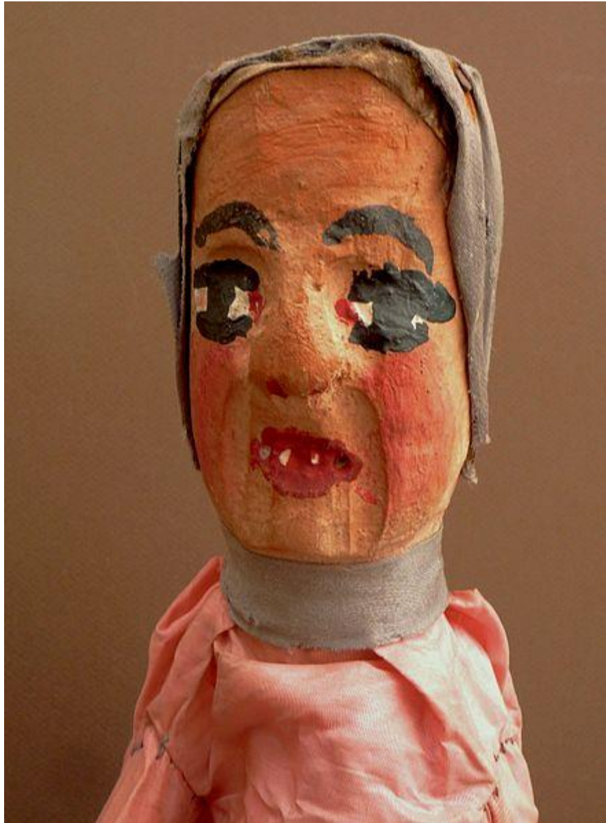
La Mère Cottivet du théâtre Guignol