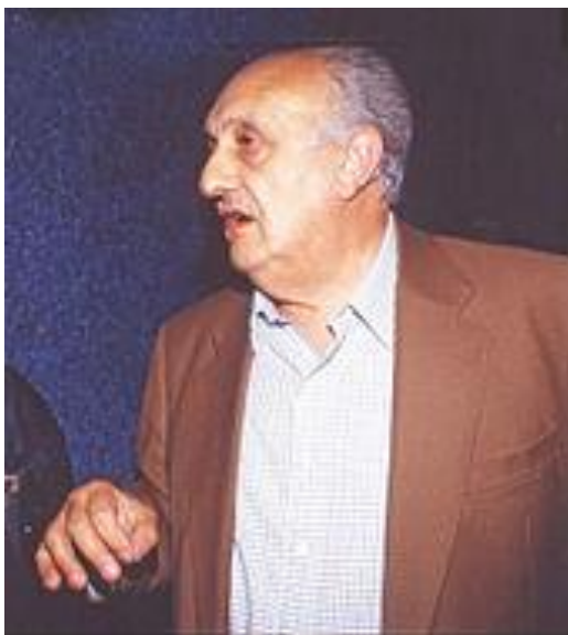
Pierre Tchernia en 1993.

Tous les cinéphiles ont à l'esprit Le Viager , film-culte où malice, bon sens et humour voisinent joliment sous la conduite du réalisateur Pierre Tchernia, dont le nom paraît devoir rimer toujours avec cinéma.