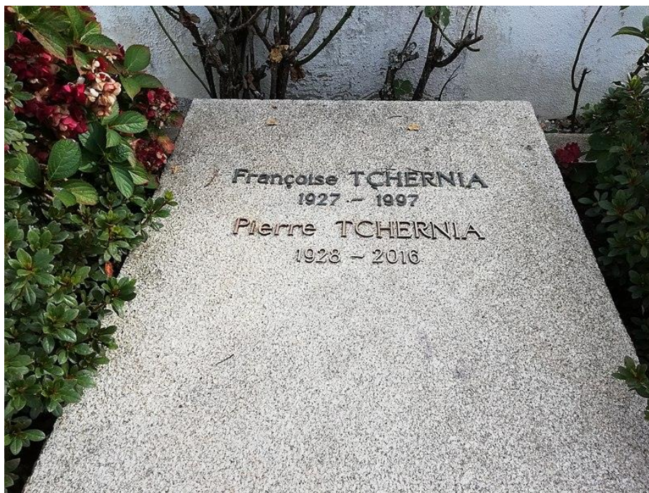
Tombe du couple Tchernia à Névez (Finistère)

En marge du monde du ciné et de la télé, ce père de 4 enfants, est collectionneur de boîtes de sardines et de maquereaux.